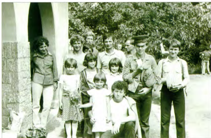
SZVSE csoportkép (Pilisvörösvár, 1979)