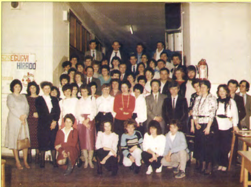
Vásárhelyi tájékoztatói futók 30 éves találkozója