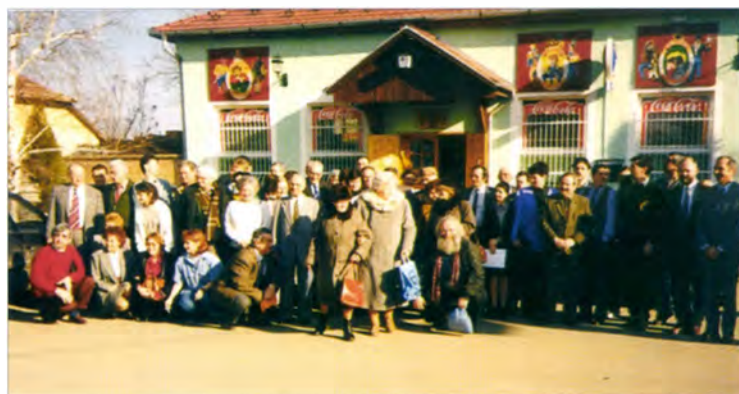
40 évi Szövetségi találkozó (Szeged-Szőreg, Két Dudás étterem, 1998)