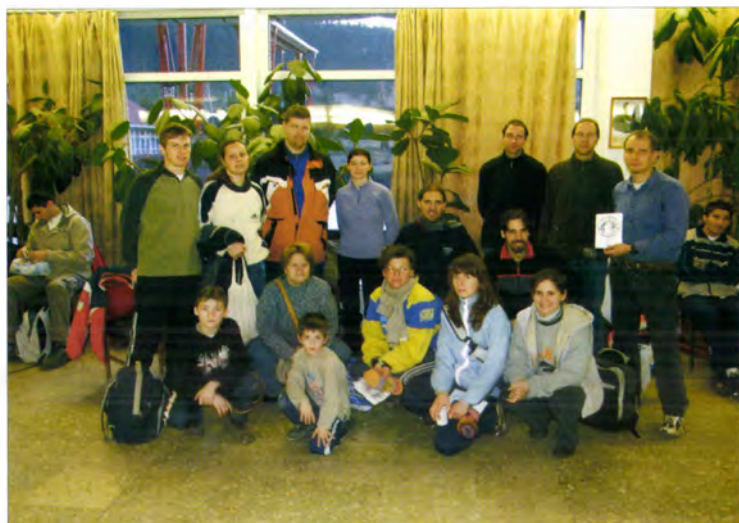
Országos Rövidtávú Bajnokság rendezői (Hódmezővásárhely, 2006)