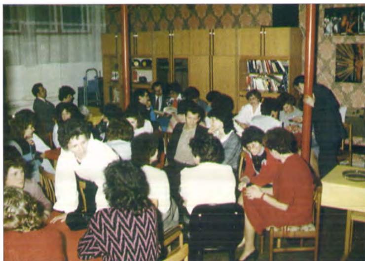
30 éves találkozó Vásárhelyen (1988)