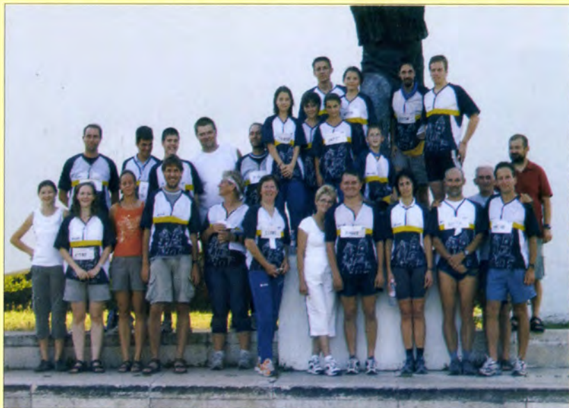
A Rövidtávú OB-n (Szolnok, 2008)