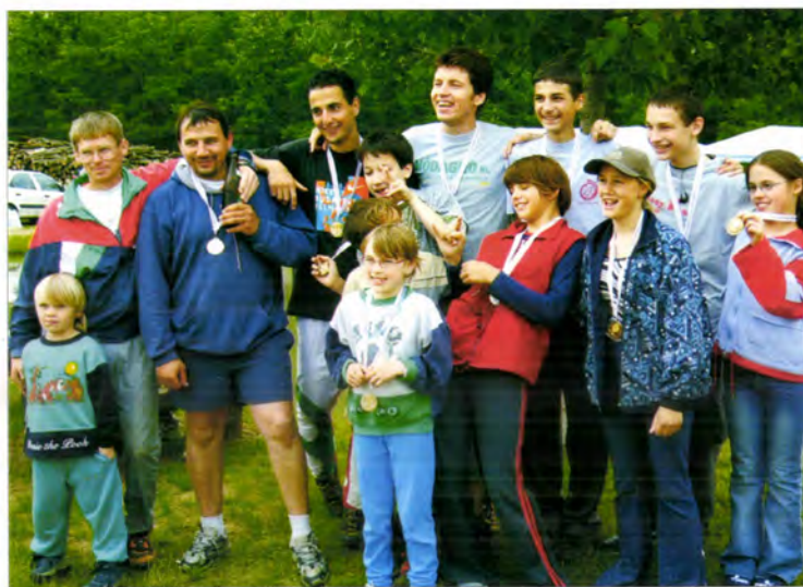
Kalocsa SE versenyzői (Királytanya, 2004)