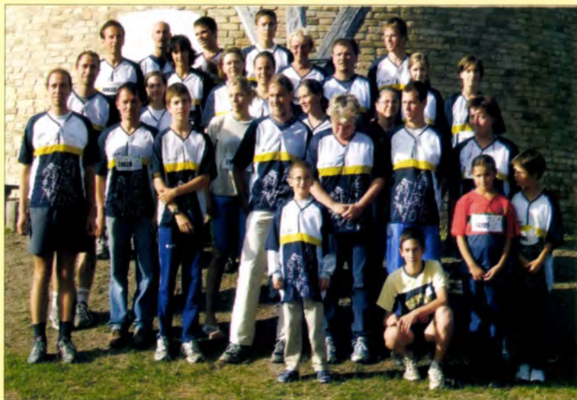
HTC csoportkép, 2006

*Hátsó borító: Részlet a GYOPÁROSI térképről