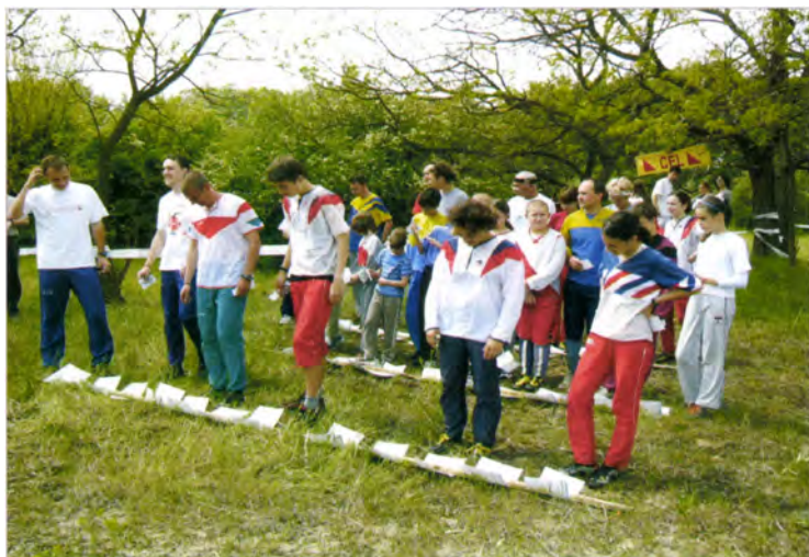
Rajtra várva (Reg. VB, Kunfehértó 2005)