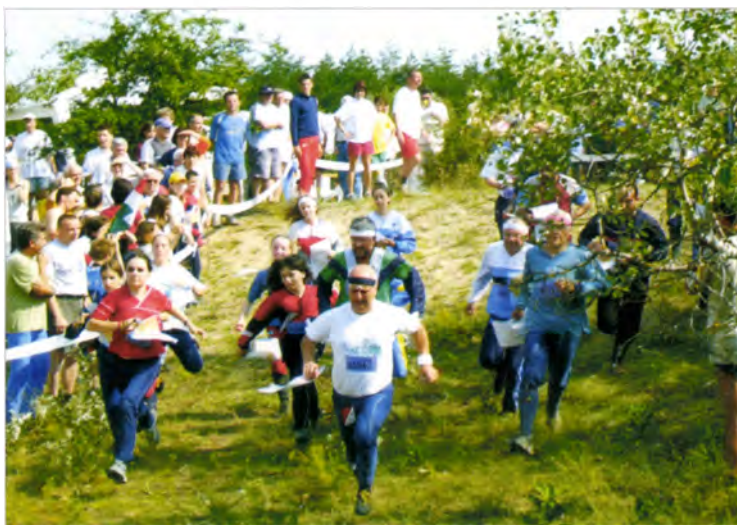
Azért ez sem akármilyen rajt Országos Váltó Bajnokság, Bodoglár, 2004