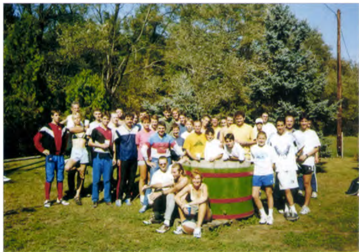
SZVSE csoportkép (Zsana, Pásztor tanya, 1999)