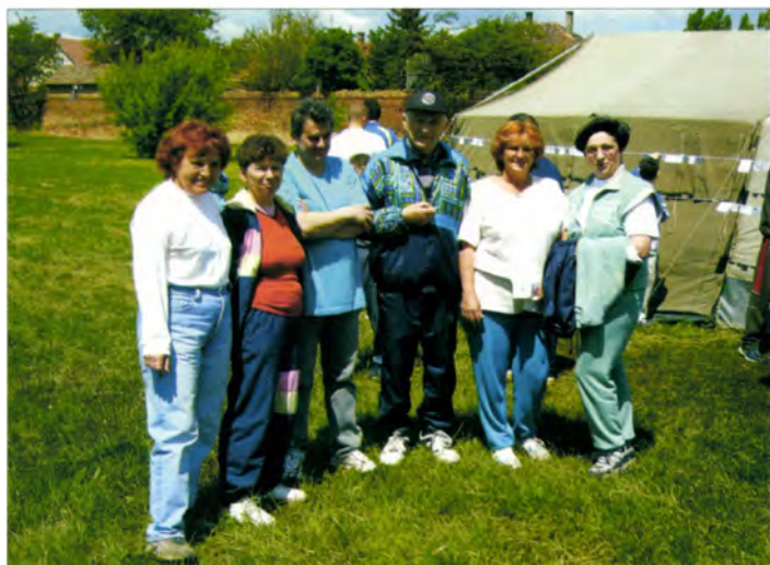
Egy kis nosztalgia kép sosem árt (Vásárhely kupa, 2004)