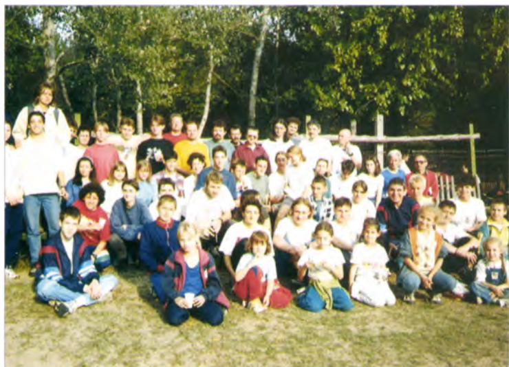
Az SZVSE rendezői 1998-ban (Zsana, Pásztor tanya)