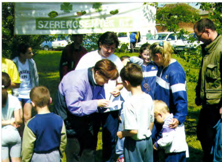
A gyermekversenyen is fontos a pontos adminisztráció (Vásárhely Kupa, 2004)