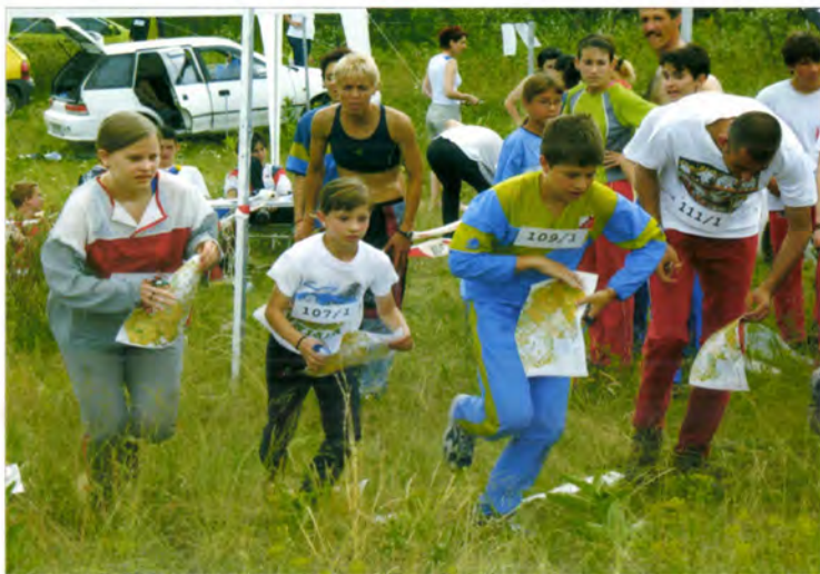
Reg. Váltóbajnokság rajtja (2005)