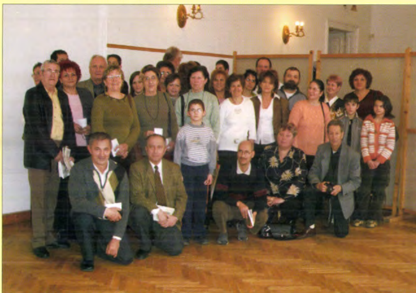
Csoportkép a megyei Szövetség 50 éves évfordulóján Szegeden