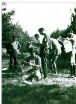
Megyei váltóversenyre készülve (1982)