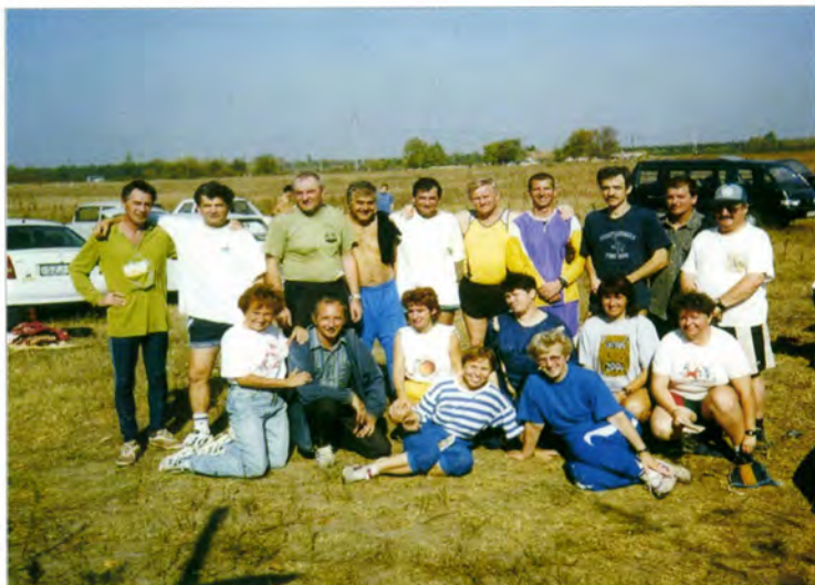
Nosztalgia Verseny résztvevői (Zsana, 2000)