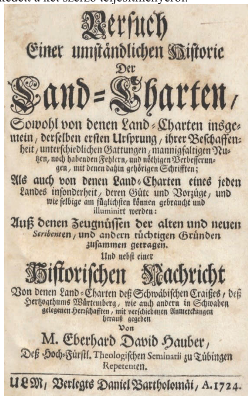
4. ábra Hauber térképtörténeti vázlatának címlapja (1724)

Hauber vázlatában öt fő részre ( Theil ) tagolta művét, amelyeken belül további szakaszokat ( Abtheilung ) majd fejezeteket ( Capitel ) tartalmi vázlatát adta. Az egyes részek igen eltérő hosszúságúak, pl. a harmadik, vízrajzi térképeket tárgyaló rész három szakaszban is csupán 5 oldal. Ezzel szemben az első rész, a tulajdonképpeni történeti áttekintés öt szakaszban és 56 oldalas. Szempontunkból természetesen ennek a résznek az áttekintése szempontunkból a legfontosabb, mivel ez a tulajdonképpeni történeti tárgyalás. Amint fentebb említettem, Hauber könyve csupán vázlat, azonban az egyes részekhez a szerző rendszeresen, és olykor meglehetősen bőséges terjedelmű lábjegyzeteket fűzött. Ezekből az olvasó jól láthatta, hogy Hauber ismeretei milyen mélységűek és terjedelműek. A kötet első részében, az első fejezet azokat a szerzőket sorolja fel, akik előtte a térképek történetével foglalkoztak. A sort a portugál Királyi Akadémia értesítőjében 1722-ben megjelent, francia nyelvű értekezéssel nyitja, megemlítve, hogy a szerző Noé idejétől kezdi a földrajz tárgyalását. Ezután azonban német kollégáit sorolja: előbb Melissantes-Gregorii széleskörű tárgyalását, majd megemlíti Gottschling korábbi, bár rövid és „ részben pontos ” munkáját. Már ennyiből is világos, hogy Hauber eltérően vélekedett a két szerző teljesítményéről.